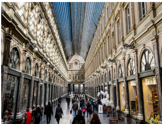
Galeries Royales Saint-Hubert

Les passants seront également conviés à confectionner leur propre edelweiss et à garnir le tapis tandis que des fleurs en papier et pin's seront mis en vente à 1€/pièce au profit des prochaines campagnes de RaDiOrg. Les origamis non-vendus seront, quant à eux, recyclés.